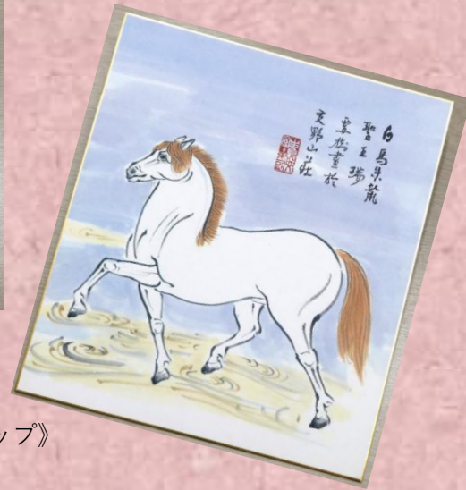
左：清水要樹《皐月》 上：清水要樹《チューリップ》 右：清水要樹《白馬》